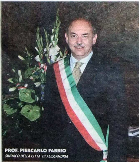
PROF. PIERCARLO FABBIO SINDACO DELLA CITTÀ DI ALESSANDRIA

nere un reparto di Terapia intensiva neonatale all'interno dell'azienda sanitaria ospedaliera, disponibili a coprire gli alti costi necessari per la realizzazione, convinti che il loro contributo favorirà un'opera utile alla collettività».